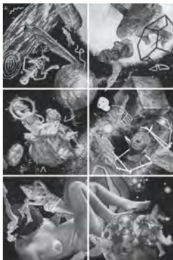
INSOMNIA NICOLAS PEGON CHARCOAL DRAWING ON PAPER 222X148cm 2016