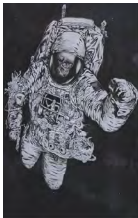
GRAVITY BAYROL JIMENEZ CHINA INK ON PAPER 260X150cm 2005

Le dessin étant considéré comme l'origine et la source de toutes les formes d'art, il semblait donc approprié de commencer ici avec une humble sélection, susciter ainsi le désir de développer cet espace et possibilités.