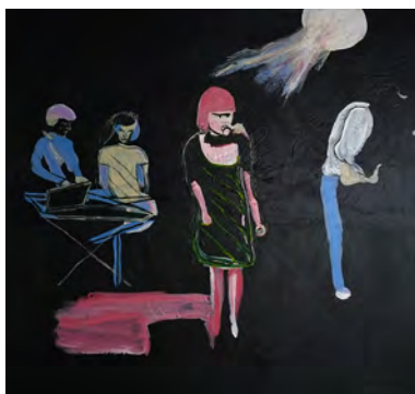
YOUNG MARBLE GIANTS DAVID WEST ACRYLIC PAINT ON CANVAS 84X84cm 2017