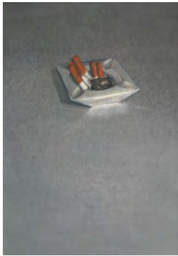
ASHTRAY DIKE BLAIR NUMERIC EDITION OF A PAINTING ON PAPER NUMBERED 1/7 51X41cm 2011