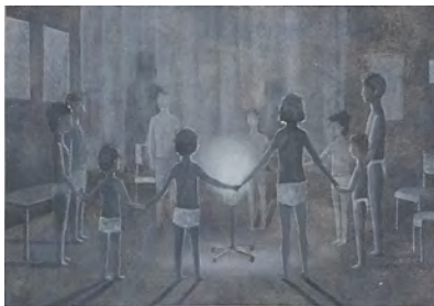
LUMINOTHÉRAPIE ANTOINE MARQUIS ACRYLIC PAINT ON CAVAS 180X120cm 2017